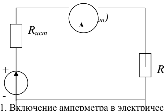
Рис. 1. Включение амперметра в электрическую цепь.

Измерение тока. В электрическую цепь включается измеритель тока (рис. 1).