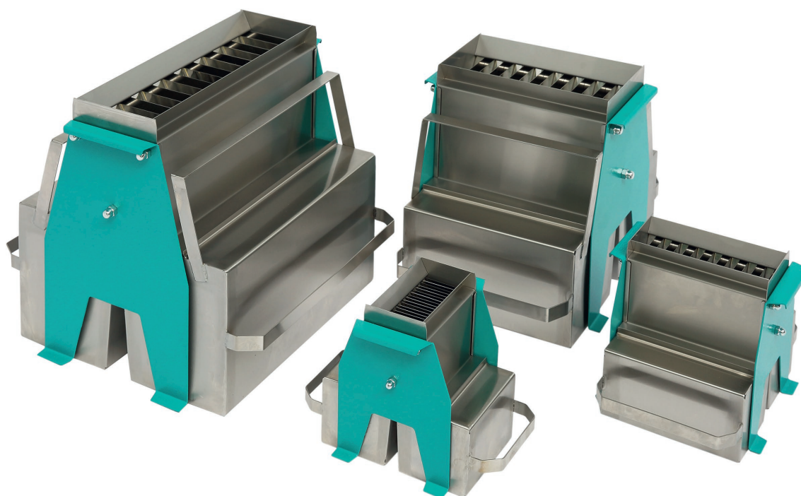
ДП 20, ДП 5, ДП 15 и ДП 10